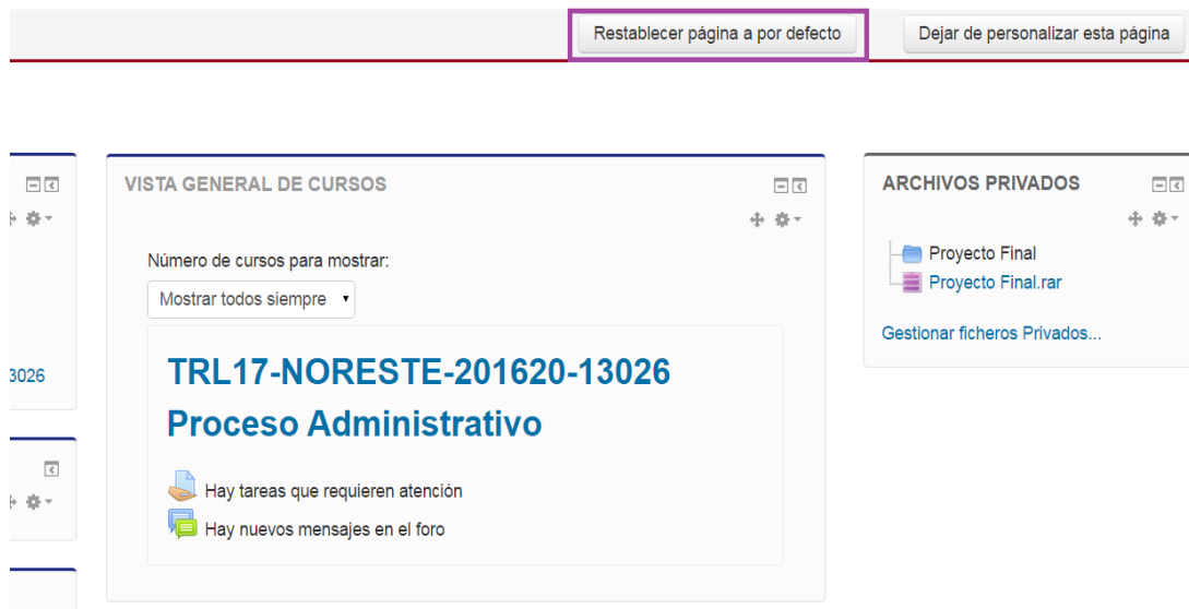
Fig. 2: Da clic en Reiniciar página a por defecto