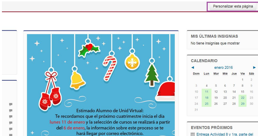
Fig. 1: Da clic en Personalizar esta página , localizado en la parte superior derecha de la pantalla.

Para tener la seguridad de que los anuncios mostrados en la plataforma, son los más recientes, basta con realizar los siguientes pasos: