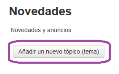
Fig. 03: Agregando un nuevo tópico