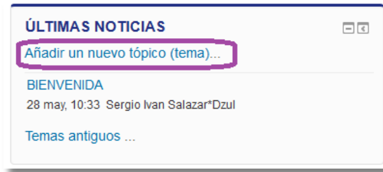
Fig. 01: Bloque Últimas Noticias